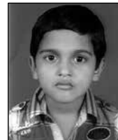
ഹാനോക്ക് വി. സ്റ്റീഫൻ ഗ്രൂപ്പ് സോംഗ് ഭദ്രാസനം 2nd സെന്റ് സ്റ്റീഫൻസ് കുടശ്ശുനാട് സെൻട്രൽ